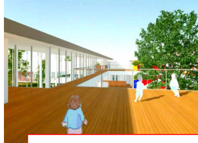
④ 2階テラスの風景 夏にはプールも設置。