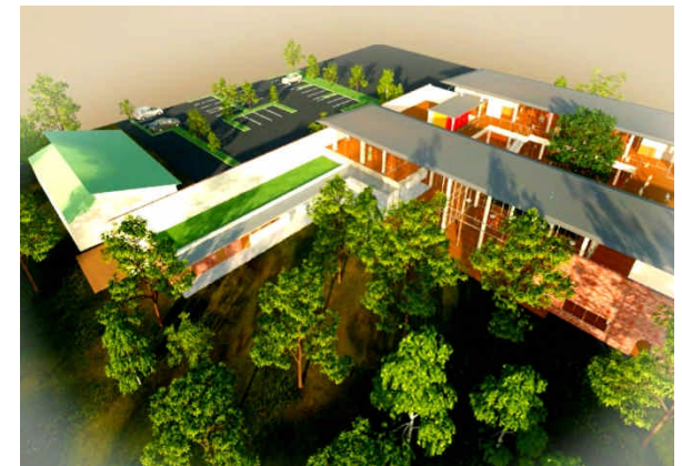
⑧ 幼稚園体育館上空より、雑木林・保育園・駐車場・正門付近・幼稚園おひさまハウスを望む。