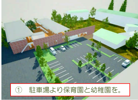
① 駐車場より保育園と幼稚園を。