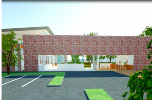
② 学園正門。 左へ進むと保育部。右へ進むと幼稚園。 中央部にはベビーカー置き場。 入口右横のショップでは教材や制服、絵本 などもおく予定です。 また、学園の正面玄関を管理室とショップ にて挟むことにより、正門付近への人の 「目」の厚みを増すことも狙いの一つです。