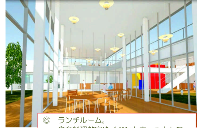
⑥ ランチルーム。 食育料理教室やイベントホールとして、 また、幼稚園児との交流の場にも活用。